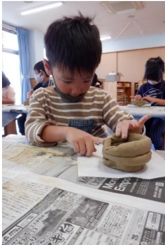
陶芸の先生に教えていただきながら、世界に一つだけの自分の茶器づくりに挑戦しました。