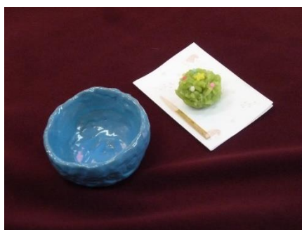
もてなす側は、懐紙やお菓子にも その時々季節